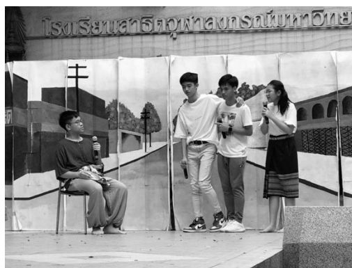
ภาพที่ 4 การแสดงละครในโครงการประเมินผลการเรียนรู้ศิลปะ ระดับชั้นมัธยมศึกษาตอนต้น (กชกร เทศอมยา, ประเทศไทย, 2563)