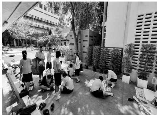
ภาพที่ 3 ผู้เรียนฝึกซ้อมและนัดหมายกันทำฉากในงานละคร (กชกร เทศถมยา, ประเทศไทย, 2563)