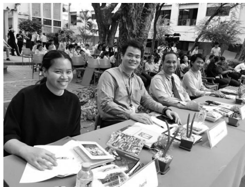
ภาพที่ 5 ผู้เชี่ยวชาญในแต่ละสาขาวิชาเชิญมาเป็นกรรมการภายนอก (กชกร เทศมยา, ประเทศไทย, 2563)

โดยในปีการศึกษา 2562 ได้กำหนดแนวคิด “Change” ของโครงการในครั้งนี้ เพื่อมุ่งเน้นนักเรียนในด้านการทำงานร่วมกันอย่างเป็นระบบ ทั้งในรูปแบบกลุ่มตามห้องเรียนและกลุ่มตามระดับชั้น ซึ่งกิจกรรมในโครงการล้วนเป็นส่วนสำคัญในการผลักดันให้นักเรียนได้พัฒนาตัวเองตลอดเวลาจากการช่วยเหลือเกื้อกูลกัน ทำให้ผลงานที่ทำออกมามีคุณภาพ จากการสร้างทีมด้วยความสามารถหรือจุดเด่นของนักเรียนแต่ละคน มีการกำหนดขอบข่ายหน้าที่ความรับผิดชอบของแต่ละฝ่ายให้ชัดเจน มีความเข้าใจการทำงานของตนเองและเพื่อน และคอยสนับสนุนซึ่งกันและกัน ทั้งนี้ เพื่อให้ให้นักเรียนทำงานกลุ่มอย่างเข้าใจและมีประสิทธิภาพ โดยการวางเป้าหมายร่วมกันเพื่อให้งานบรรลุความสำเร็จ นอกจากนี้ เมื่อเสร็จสิ้นโครงการนักเรียนจะได้เรียนรู้ทั้งการมีภาวะผู้นำที่ดีและการเป็นผู้ตามที่มีวินัย ผลที่เกิดขึ้นได้เป็นที่ประจักษ์จากความต้องการที่จะพัฒนาศักยภาพของผู้เรียนให้เกิดการพัฒนาทางความคิดสร้างสรรค์ และรู้จักการบูรณาการประยุกต์ใช้ความรู้ได้อย่างเหมาะสม กลุ่มสาระการเรียนรู้ศิลปะซึ่งประกอบด้วยเนื้อหาวิชาการและทักษะด้านทัศนศิลป์ ดนตรี และนาฏศิลป์ ได้ใช้มาตรฐานการเรียนรู้ตามหลักสูตร เพื่อให้ผู้เรียนได้มีพัฒนาการด้านทักษะในการสร้างผลงานตามจินตนาการและความคิดสร้างสรรค์ สามารถวิเคราะห์ วิพากษ์วิจารณ์ และเห็นคุณค่าของศิลปะ ถ่ายทอดความรู้ ความคิดต่อทัศนศิลป์ ดนตรี และนาฏศิลป์ได้อย่างอิสระ มีใจชื่นชม และสามารถนำความรู้ และทักษะทางศิลปะไปประยุกต์ใช้ในชีวิตประจำวันได้จริง