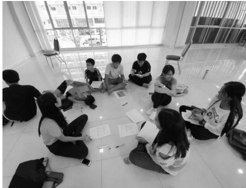
ภาพที่ 2 ผู้เรียนนัดประชุมงานละคร (กชกร เทศมยา, ประเทศไทย, 2563)

เมื่อผู้สอนกำหนดปฏิทินการทำงาน จึงทำให้ผู้เรียนวางแผนการทำงานของตัวเองได้ เพราะทั้ง 7 ห้องเรียนมีวิธีการดำเนินการแตกต่างกันออกไป โดยผู้สอนจะกำหนดวันรายงานความก้าวหน้าของการทำละครห้อง โดยผู้ที่มีหน้าที่รายงานความก้าวหน้าของละครห้อง คือ ผู้กำกับการแสดงและผู้กำกับเวที นอกจากการรายงานความก้าวหน้า ผู้กำกับทั้งสองจะต้องบอกปัญหาที่เกิดขึ้นระหว่างการทำงาน หรือระหว่างการฝึกซ้อมละครห้องได้ เพื่อช่วยกันหาแนวทางแก้ไขต่อไป