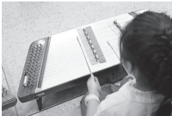
ภาพที่ 2 การใช้แถบสีเพื่อจำแนกเสียงสูง-ต่ำของซิม (สีฟ้า-สีแดง-สีเหลือง)

การใช้แถบสีแบ่งโซนของเสียงซิมจึงถูกนำมาปรับใช้เพื่อช่วยให้ผู้เรียนเกิดภาพจำใหม่ แทนตัวอักษร ด ร ม ฟ ซ ล ท บนหน้าซิม ภาพจำที่เกิดขึ้นจึงเป็นเพียงตำแหน่งอย่างคร่าวๆของเสียงต่าง ๆ ดังนั้นในขณะที่ต่อเพลง หรือตีซิมผู้เรียนจะได้ฝึกสังเกตมากขึ้นว่า ตำแหน่งโน้ตแต่ละตัวนั้นอยู่ในตำแหน่งใด การปรับสายตาของผู้เรียนจึงเป็นการสังเกตลำดับของหย่องซิม ได้ฝึกสังเกตจำนวนหย่องที่ถูกข้ามระหว่างการตี ได้ฝึกสังเกตระดับเสียงโดยใช้จินตนาการและภาพจำเรื่องสีแทนที่ตัวอักษร วิธีการที่หลีกเลี่ยงการวางแผ่นกระดาษที่ปรากฏอักษร ด ร ม ฟ ซ ล ท บนหน้าซิมนี้พบว่า จะช่วยให้ผู้เรียนมีพัฒนาการทางด้านการตีซิมได้ดีขึ้น ทักษะการจำขณะต่อเพลงทำได้ดีขึ้น ในวิธีดังกล่าวนี้สามารถใช้อักษร ด ร ม ฟ ซ ล ท วางกำกับตำแหน่งของเสียงซิมแต่ละหย่องไว้ที่แผ่นผังซิมจำลองที่ผู้สอนใช้เป็นสื่อกลางสำหรับสาธิตให้ผู้เรียนดูพร้อมกัน