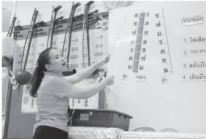
ภาพที่ 4 ผู้สอนสาธิตการตีขิม

เทคนิคการตีบนอากาศก่อนการตีที่ขิมจริงนั้น ช่วยฝึกให้ผู้เรียนได้ใช้ความคิดและจินตนาการสร้างภาพจำด้วยตนเอง ถึงแม้ผู้เรียนอาจจะมึนวิธีการสร้างภาพจำที่อาจแตกต่างกัน แต่เมื่อผู้สอนได้ทำครบกระบวนการของการสาธิต การท่อนोट การให้เวลากับผู้เรียนได้จัดระบบความคิดของตัวเองในแต่ละช่วงเวลาของการต่อทำนองเพลงใหม่ พบว่า ผู้เรียนจะสามารถเชื่อมโยงสิ่งที่ได้เรียนรู้และสามารถปฏิบัติเครื่องดนตรีได้โดยพร้อมเพรียงกัน