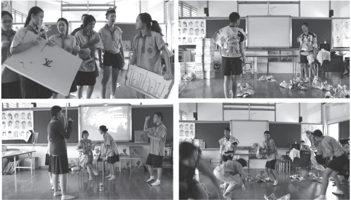
ภาพประกอบที่ 2 ผลงานศิลปะสื่อการแสดง (Performance Art) ของนักเรียนในวิชา จินตทัศน์เคลื่อนไหว (Motion Imaging Art)

(Imaging Art Project) เป็นต้น ที่ให้นักเรียนได้ศึกษา มีความรู้ ความเข้าใจแนวคิด กระบวนการสร้างงาน ตลอดจนฝึกปฏิบัติสร้างสรรค์ผลงานศิลปะที่หลากหลายสื่อแสดง ออกบนฐานความคิดสร้างสรรค์ จินตนาการ อย่างเป็นระบบ