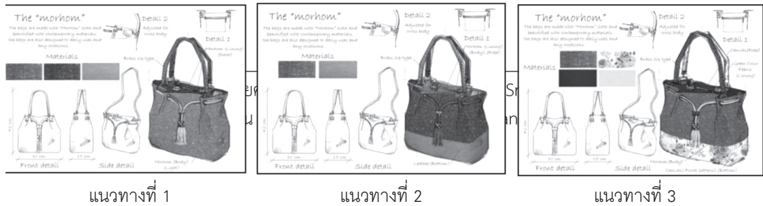
ภาพที่ 1 แบบร่างกระเป๋าถือสุภาพสตรีจากผ้าห่มห่อด้วยการทอแบบลายสอง จำนวน 3 แนวทาง

1.4.2.6 นำผลิตภัณฑ์ต้นแบบไปเก็บข้อมูลประเมินความเหมาะสมกับผู้บริโภคกลุ่มเป้าหมาย ในด้านความงาม (Appearance) โดยแบบประเมินเป็นคำถามแบบมาตราส่วนประมาณค่า (Rating Scale) 5 ระดับ