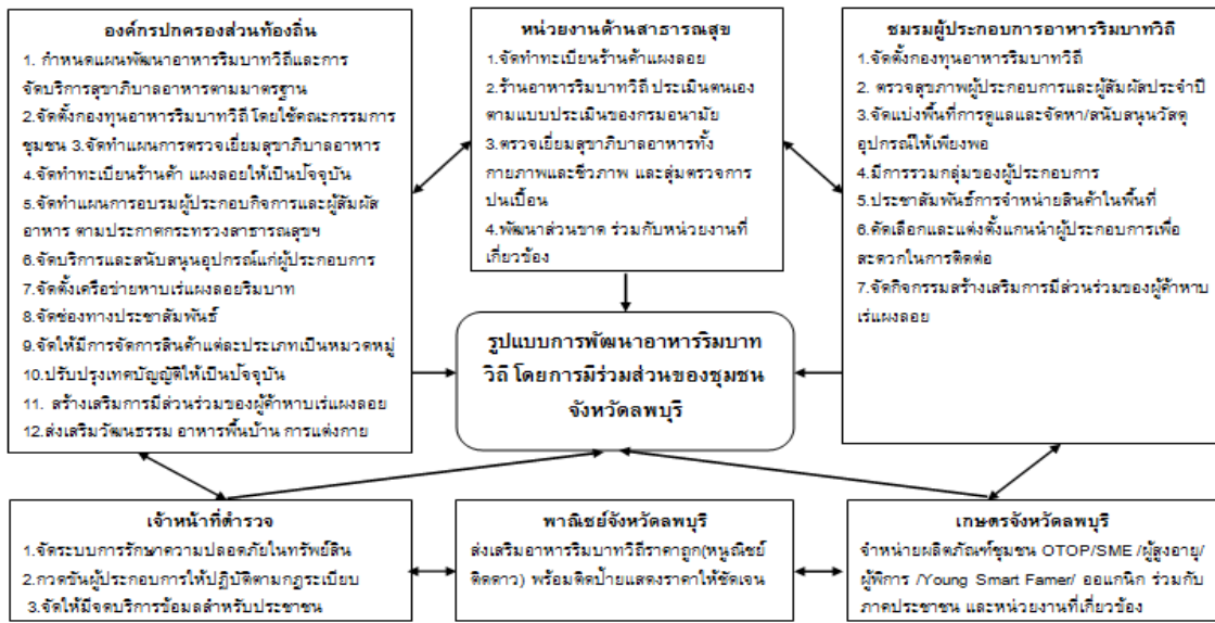
ภาพที่ 2 รูปแบบการพัฒนาอาหารริมบาทวิถีโดยการมีส่วนร่วมของชุมชนจังหวัดลพบุรี

4. การนำนโยบายสาธารณะไปปฏิบัติ (public policy implementation) ผลการศึกษาพบว่า การนำนโยบายสาธารณะไปสู่การปฏิบัติ มาจากการสร้างความร่วมมือในการรับมือของภาคส่วนต่าง ๆ ที่เกี่ยวข้องแปลงแผนไปสู่การปฏิบัติโดยผนวกไปกับกิจกรรมการพัฒนาตามภารกิจที่เกี่ยวข้องของแต่ละหน่วยงานทั้งภาครัฐ ท้องถิ่น และผู้ประกอบการ การนำนโยบายอาหารริมบาทวิถีไปสู่ปฏิบัติประกอบด้วย 7 โครงการแบ่งเป็น 2 กลุ่มได้แก่ (1) โครงการที่ชมรมผู้ประกอบการจะดำเนินการด้วยตนเอง 3 โครงการ และ (2) โครงการที่หน่วยงานและองค์กรในพื้นที่ร่วมกันดำเนินงานจำนวน 4 โครงการ