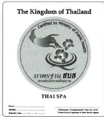
รูปที่ 2 : ตราสัญลักษณ์มาตรฐานสถานประกอบการเพื่อสุขภาพ