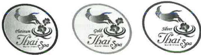
รูปที่ 1 : ตราสัญลักษณ์แสดงคุณภาพสถานประกอบการสปาเพื่อสุขภาพ (ที่มา: กรมสนับสนุนบริการสุขภาพ กระทรวงสาธารณสุข)

กระทรวงสาธารณสุข เรื่องกำหนดสถานที่เพื่อสุขภาพหรือเพื่อเสริมสวย มาตรฐานของสถานที่การบริการผู้ให้บริการหลักเกณฑ์และวิธีการตรวจสอบเพื่อการรับรองให้เป็นไปตามมาตรฐานสำหรับสถานที่เพื่อสุขภาพหรือเพื่อเสริมสวย ตามพระราชบัญญัติสถานบริการ พ.ศ. 2509 และประกาศกระทรวงสาธารณสุข (ฉบับที่ 2) โดยได้จัดทำหนังสือเกณฑ์การรับรองคุณภาพสถานประกอบการสปาเพื่อสุขภาพเพื่อใช้เป็นเครื่องมือในการพัฒนาและประเมินรับรองคุณภาพของสถานประกอบการสปาเพื่อสุขภาพ โดยต้องการยกระดับมาตรฐานสถานประกอบการให้มีคุณภาพที่สูงขึ้นและเป็นที่ยอมรับในระดับสากล โดยแบ่งคุณภาพสถานประกอบการสปาเพื่อสุขภาพออกเป็น 3 ระดับ ได้แก่ ระดับ Platinum ระดับ Gold และระดับ Silver 40 ผู้ประกอบการที่ผ่านการรับรองมาตรฐานจะได้รับเครื่องหมายการันตีคุณภาพมาตรฐานระดับสากล 41